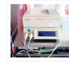
เครื่องบันทึกการติดตามการบีบตัวของมดลูก และการเต้นของหัวใจทารกในครรภ์ ชนิดแปรผล 350,000.-