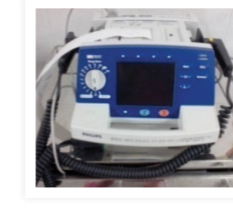
เครื่องกระตุ้นหัวใจด้วยไฟฟ้าแบบมีจอภาพ 325,000.-

มูลนิธิ ทุนท่าน้าว มหาพรหม โรงแรมเอราวัณ