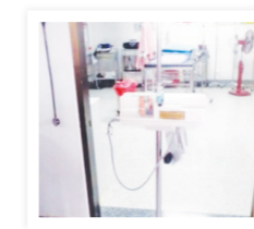
เครื่องควบคุมการให้สารละลายด้วยกระบอกฉีดยา 240,000.- และรายการเครื่องมือแพทย์อื่นๆ รวมเป็นเงิน 1,000,000.- (หนึ่งล้านบาทถ้วน)

คุณพรศักดิ์ - คุณฤดีวรรณ นายแพทย์สราวุธ สุวรรณปทุมเลิศ (หจก.ถาวรซูเปอร์มาร์เก็ต)