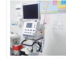
เครื่องช่วยหายใจ สำหรับทารกแรกเกิด-ผู้ใหญ่ 700,000.-

มูลนิธิ ทุนท่าน้าว มหาพรหม โรงแรมเอราวัณ