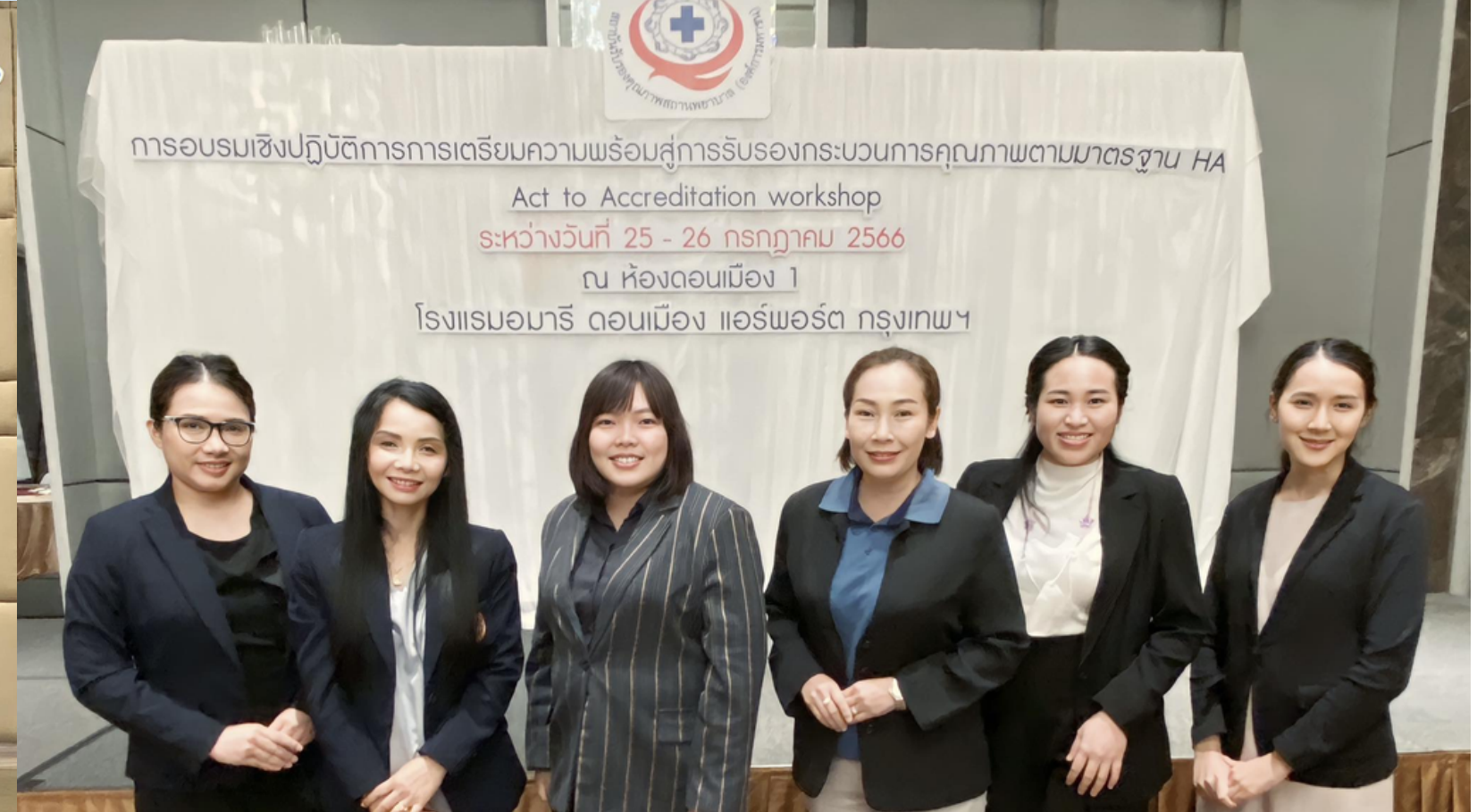
การอบรมเชิงปฏิบัติการการเตรียมความพร้อมสู่การรับรองกระบวนการคุณภาพตามมาตรฐาน HA Act to Accreditation workshop ระหว่างวันที่ 25 - 26 กรกฎาคม 2566 ณ ห้องดอนเมือง 1 โรงแรมอมารี ดอนเมือง แอร์พอร์ต กรุงเทพฯ