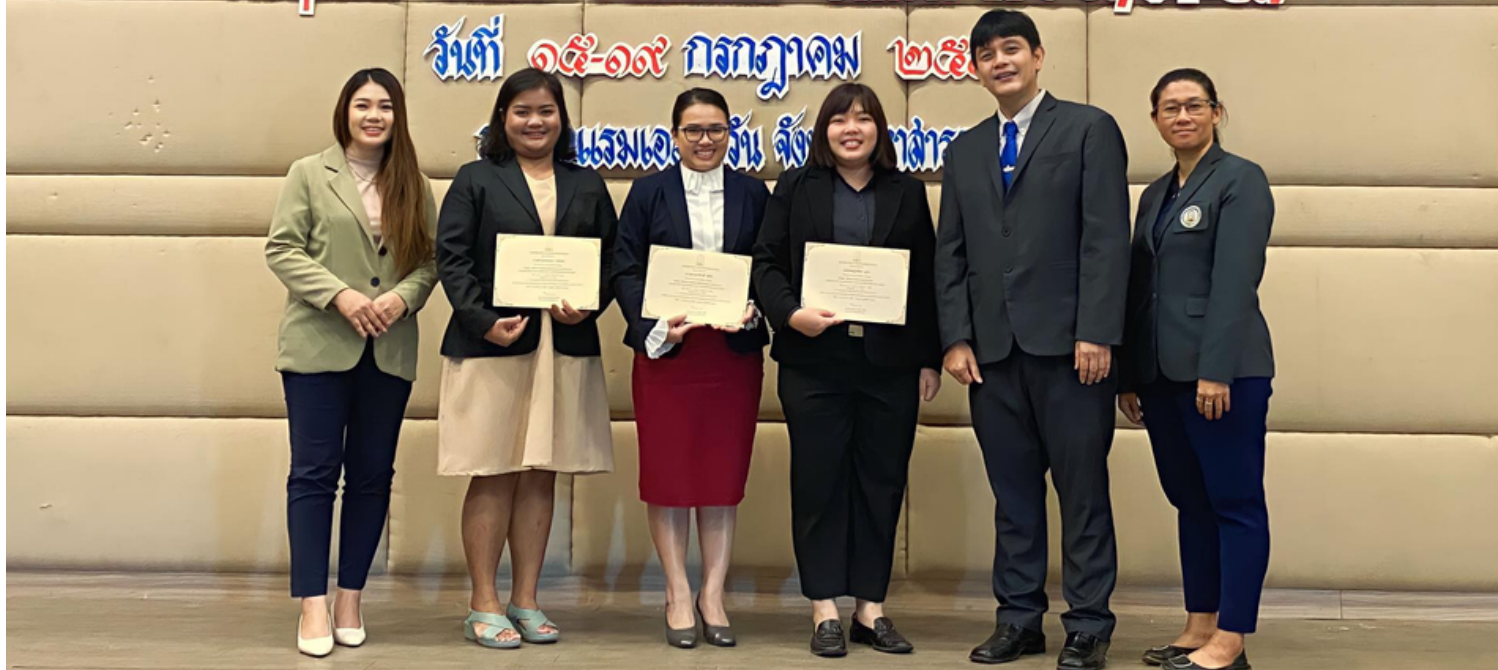
วันที่ ๑๕-๑๙ กรกฎาคม ๒๕๖๖