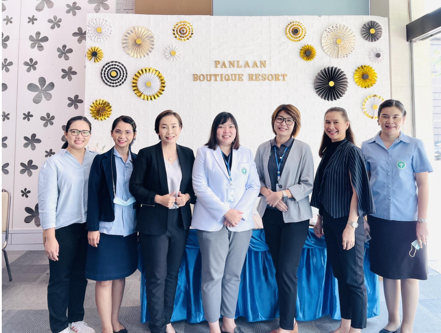
โครงการอบรมเชิงปฏิบัติการการดูแลสุขภาพ