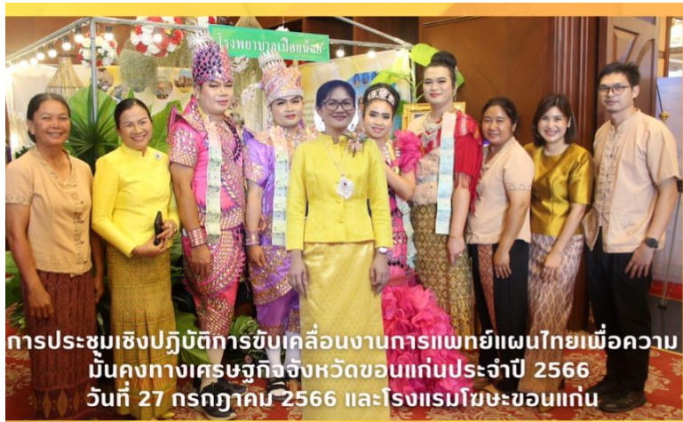
การประชุมเชิงปฏิบัติการขับเคลื่อนงานการแพทย์แผนไทยเมื่อความมั่นคงทางเศรษฐกิจจังหวัดขอนแก่นประจำปี 2566 วันที่ 27 กรกฎาคม 2566 และโรงแรมโฆษะขอนแก่น